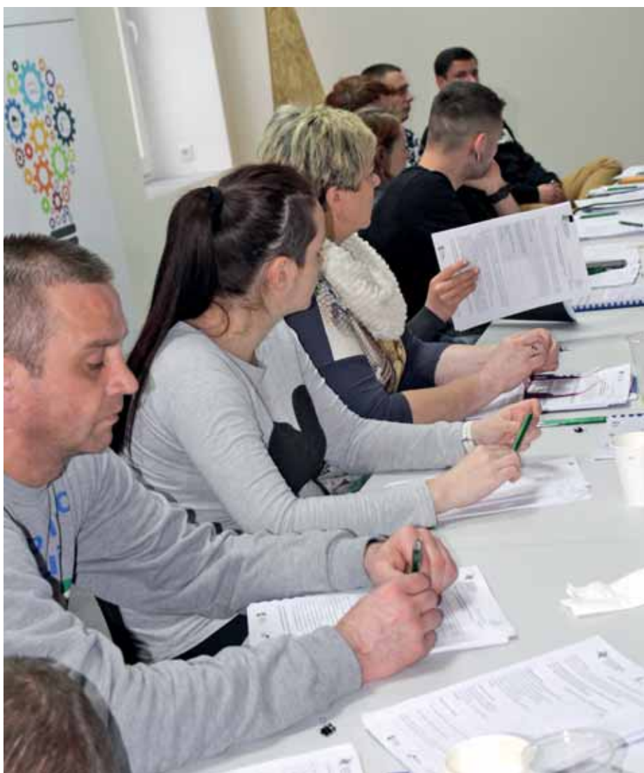
Uczestnicy szkolenia w skupieniu słuchali wskazówek trenerki...

Recepta na sukces: przyszłym przedsiębiorcom przede wszystkim potrzebne są takie cechy jak: odwaga w podejmowaniu decyzji, odpowiedzialność, kreatywność, systematyczność, zaangażowanie. I dobry biznesplan na biznes. Oraz pomoc fachowców, którzy na początku pomogą i podpowiedzą. Dlatego zapraszamy do Ośrodka Wsparcia Ekonomii Społecznej w Zielonej Górze!