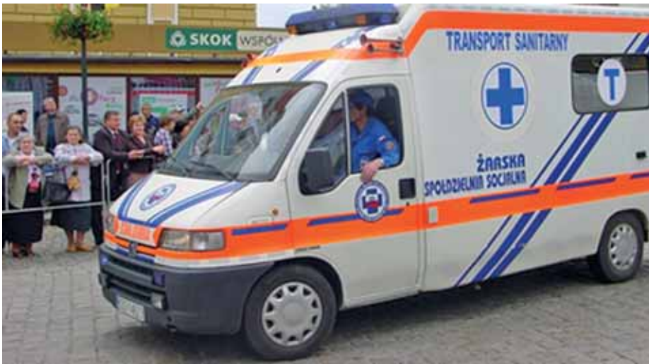
Przekazanie karetki do nowo tworzonej spółdzielni socjalnej w Piotrowie (powiat żarski).

zachęcić takiego przedsiębiorcę do pomocy ludziom w utworzeniu spółdzielni. Powiedzieć jak to działa, że to również dla niego korzystne, bo ci ludzie zakupią własny sprzęt, ubrania robocze, dostaną pieniądze na rozkręcenie działalności, a on im będzie zlecać prace. Kilka takich podmiotów udało nam się założyć.