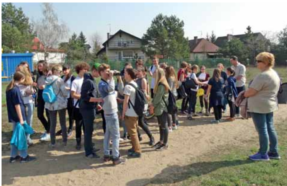
Wyjście na lekcję terenową.

w taki sposób, aby pokrywała wyłącznie realne koszty. Cena warsztatu to 8 zł za osobę, a zajęć w terenie to 5 zł. Do tej pory nie spotkałam się z opinią, że propono-