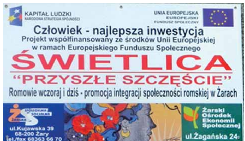
Świetlica dla dzieci romskich „Przyszłe szczęście”.

Prowadziliśmy noclegownię. Zimą przebywało tu do 30 osób, latem 15-17. Budżet zakładał mniej i brakowało na środki, na jedzenie. Ceny też wzrosły. Dlatego wymyśliliśmy serduszka, którymi oklejamy sprzedawane przez nas