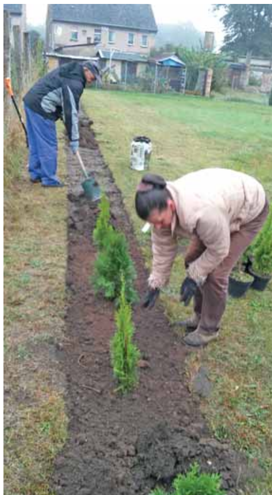
Członkowie spółdzielni przy pracy.